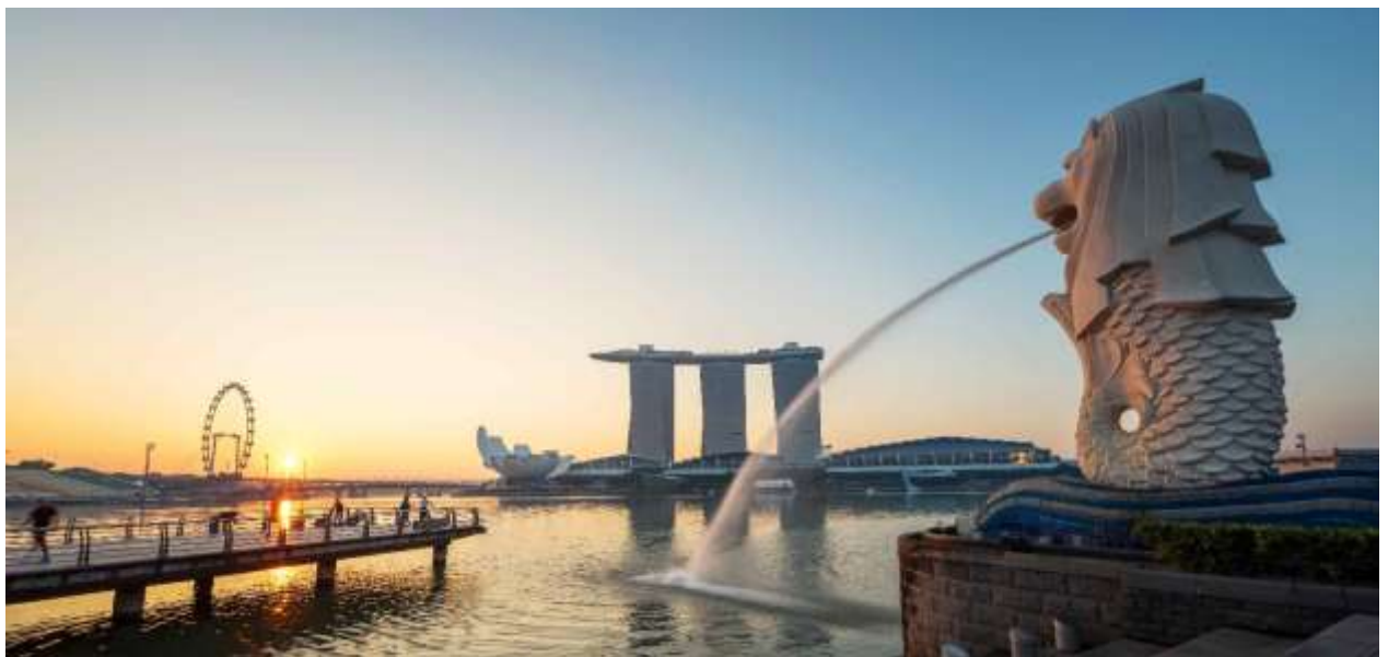
***(อิสระอาหารกลางวัน เพื่อความสะดวกในการท่องเที่ยว)**

จากนั้นนำท่าน ชมเมืองสิงคโปร์และรับฟังบรรยายประวัติศาสตร์จากไกด์ท้องถิ่นซึ่งล้อมรอบด้วย ทำเนียบรัฐบาล ศาลฎีกาและศาลาว่าการเมือง ชม ถนนอลิซาเบธวอล์ค ซึ่งเป็นจุดชมวิวยามค่ำคืนน้ำสิงคโปร์ ผ่านชม อาคารรัฐสภาเก่า "Old Parliament House" ซึ่งในอดีตเป็นที่ตั้งของรัฐสภาของสิงคโปร์ ปัจจุบันเป็นจุดรวมของ ศิลปะ ดนตรี การเดินรำ การแสดงตลก นำท่าน ถ่ายรูปคู่กับ เมอร์ไลออน สัญลักษณ์ของประเทศสิงคโปร์ โดยรูปปั้นครึ่งสิงโตครึ่งปลาหน้าหันหน้าออกทางอ่าวมาริน่า มีทัศนียภาพที่สวยงามโดยมีฉากด้านหลังเป็น "โรงละครเอสพลานาด" โดดเด่นด้วยสถาปัตยกรรมคล้ายหอนามทุเรียน นำท่านแวะชม น้ำพุแห่งความมั่งคั่ง Fountain of Wealth แห่งเมืองสิงคโปร์ตั้งอยู่ท่ามกลางหมู่ตึกชั้นเทคโนโลยี ชั้นเทคโนโลยี มาจากคำในภาษาจีน แปลว่าความสำเร็จขึ้นใหม่ หมู่ตึกชั้นเทคโนโลยีสร้างขึ้นโดยนักธุรกิจชาวฮ่องกง ซึ่งนับเป็นโครงการพาณิชย์ขนาดใหญ่ที่สุดของเมือง โดยคนสิงคโปร์เชื่อว่าถ้าได้เดินรอบลานน้ำพุ และได้สัมผัสน้ำจะพบโชคดีและ ร่ำรวยตลอดปี นำท่านเดินทางสู่ย่านไชน่าทาวน์ ชม วัดพระเขี้ยวแก้ว (Buddha Tooth Relic Temple) สร้างขึ้นเพื่อเป็นที่ประดิษฐานพระเขี้ยวแก้วของพระพุทธเจ้า วัดพระพุทธศาสนาแห่งนี้สร้าง สถาปัตยกรรมสมัยราชวงศ์ถัง วางศิลาฤกษ์ เมื่อวันที่ 1 มีนาคม 2005 ค่าใช้จ่ายในการก่อสร้างทั้งหมดราว 62 ล้านดอลลาร์สิงคโปร์ (ประมาณ 1,500 ล้านบาท) ชั้นล่างเป็นห้องโถงใหญ่ใช้ประกอบศาสนพิธีชั้น 2-3 เป็นพิพิธภัณฑ์และห้องหนังสือ ชั้น 4 เป็นที่ประดิษฐานพระเขี้ยวแก้ว (ห้ามถ่ายภาพ) ให้ท่านได้สักการะองค์เจ้าแม่กวนอิมและใกล้กันก็เป็นวัดแขกซึ่งมีศิลปกรรมการตกแต่งที่สวยงาม