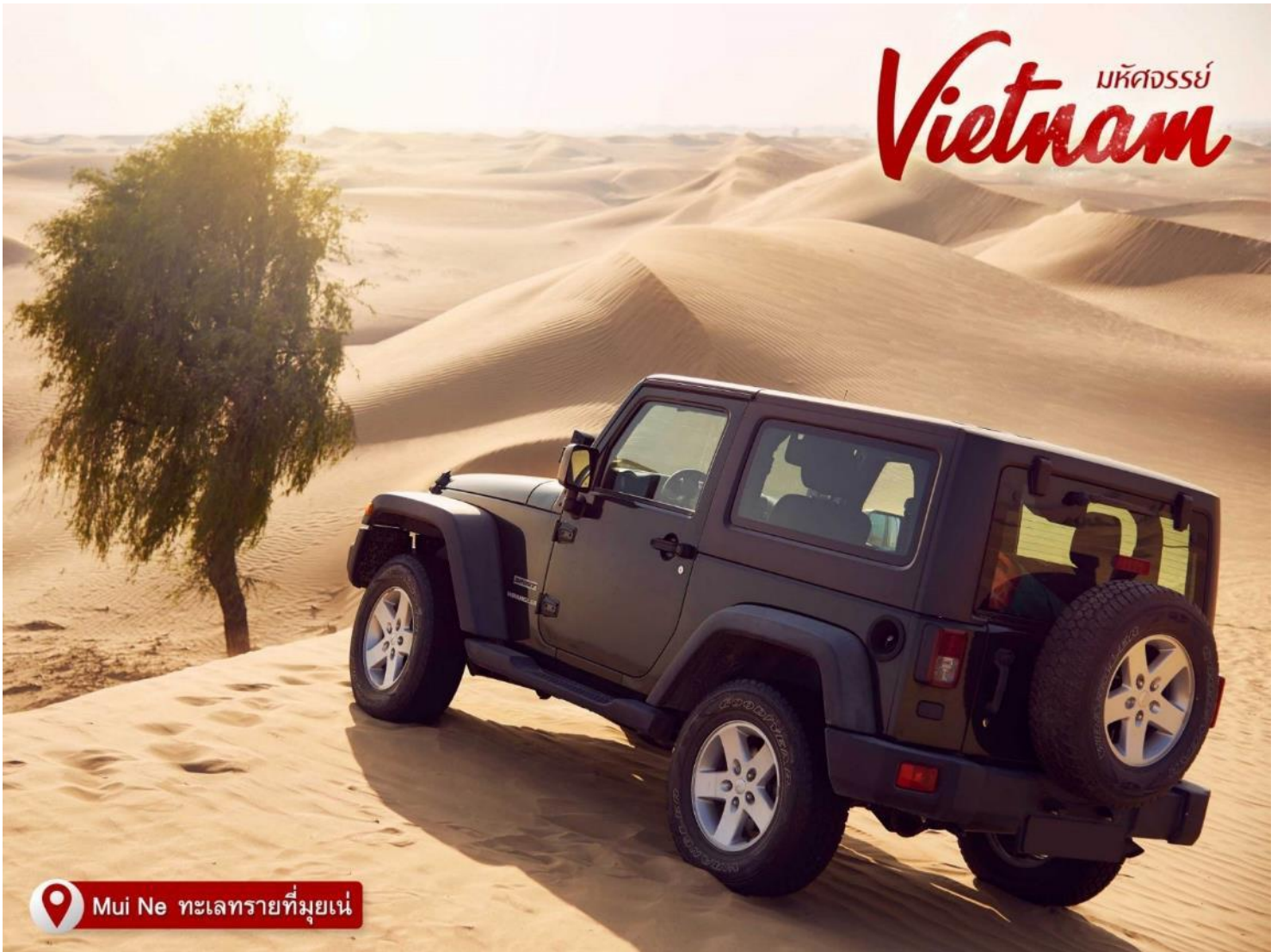
Mui Ne ทะเลทรายที่มุยเน่