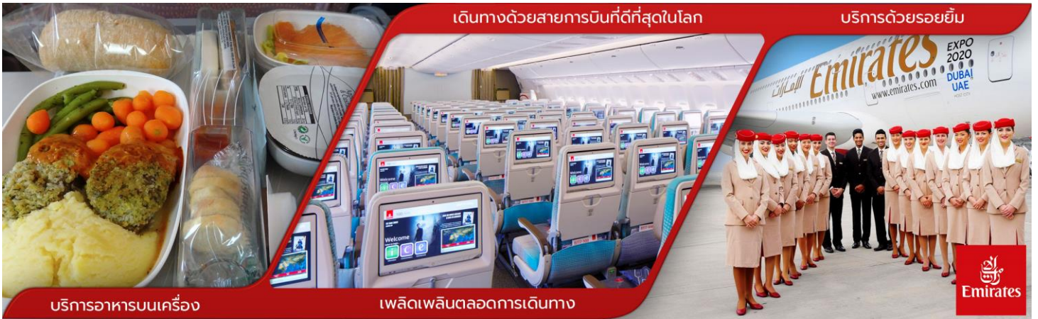
บริการอาหารบนเครื่อง