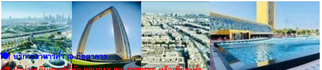
บริการอาหารค่ำ ณ ภัตตาคาร

นำท่านเดินทางสู่ที่พัก HOLIDAY INN EXPRESS หรือเทียบเท่า