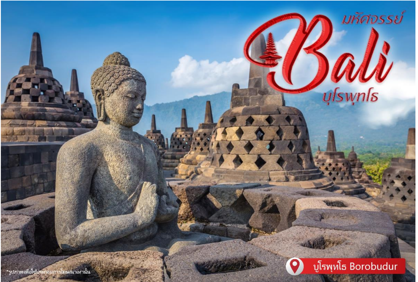
*รูปภาพเพื่อใช้ประกอบการโฆษณาเท่านั้น