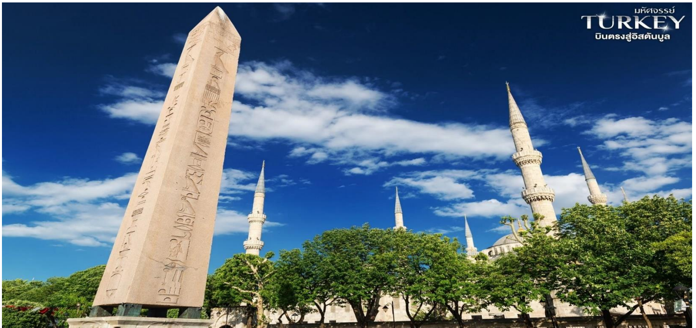
มหิตจสมัย TURKEY ปีนครงสูอิสตันบูล

ชมจัตุรัสสุลต่าน อาห์เหม็ด(Sultanahmed Complex) หรือที่มีชื่อเรียกมาแต่โบราณว่า ฮิปโปโดรม (Hippodrome) ซึ่งย่านแห่งนี้แต่เดิมเป็นจุดศูนย์กลางของเมืองในยุคไบแซนไทน์และใช้เป็นลานกว้างสำหรับแข่งกีฬาขั้รถม้า แต่ในปัจจุบันเหลือเพียงร่องรอยจากอดีตที่มีแค่ลานและเสาโบราณอีก 3 ต้น คือ เสาโอเบลิสก์แห่งจักรวรรดิเฮโรโดเซียส (Theodosius Obelisk) เป็นเสาทรงสี่เหลี่ยมฐานกว้างแล้วค่อย ๆ เรียวยาวขึ้นไปเป็นยอดแหลมส่วนเสาโบราณต้นที่ 2 เรียกกันทั่วไปว่า เสางู (Bronze Serpentine Column) เป็นเสาบรอนซ์ที่แกะสลักเป็นรูปงู 3 ตัวพันเกี่ยวกันไปมา ได้รับการยอมรับว่าเป็นเสาแบบกรีกที่เก่าแก่ที่สุดที่มีเหลืออยู่ในอิสตันบูล และเสาต้นที่ 3 มีชื่อว่า เสาคอนสแตนติน (Column of Constantine) สร้างขึ้นในปี พ.ศ. 1483 แต่เดิมเป็นเสาบรอนซ์ แต่ในช่วงสงครามครูเสดได้ถูกศัตรูหลอมเอาบรอนซ์ออกไปจนเหลือเพียงแค่เสาปูนเท่านั้น