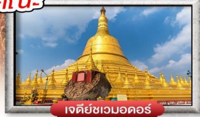
เจดีย์ชเวดากอง

เมนู สุดพิเศษ | กุ้งแม่น้ำเผา + บุฟเฟ่ต์นานาชาติ 3 วัน 2 คืน อาหาร : 6 มื้อ เดินทาง ก.ค. 2565 เป็นต้นไป