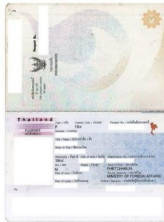
หมายเหตุ : สแกนสีเท่านั้น