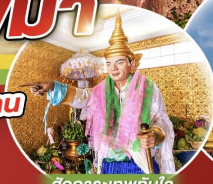
สักการะเทพทันใจ