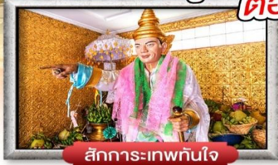
สักการะเทพทันใจ