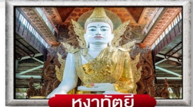
หงากัตติยี่