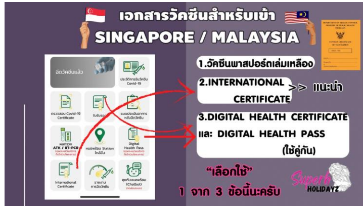
International Covid19 Vaccination Certificate

ไม่รวมค่าทิปไกด์+ค่าทิปคนขับรถเหมาจ่ายท่านละ 1,500 บาทชำระที่สนามบินสุวรรณภูมิ (ไม่รวมค่าทิปหัวหน้าทัวร์ตามความพึงพอใจ)