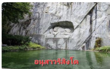
อนุสาวรีย์สิงโต

ลูเซิร์น ( KAPELLBRUCKE ) ซึ่งเป็นสะพานไม้ที่มีหลังคาคลุมตลอดดัวข้ามแม่น้ำ รูซซ์ (REUSS) อายุเก่าแก่กว่า 400 ปี และยังเป็นสัญลักษณ์ของสวิส...อิสระให้ท่านช้อปปิ้งสินค้าชั้นนำของสวิสตามอรัยาศัย อาทิ นาฬิกาชั้นนำ ผ้าลูกไม้สวิส ช็อคโกแลต มิดพับวิกทอเรีย นาฬิกาตุ๊กตุ๊ก ฯลฯ